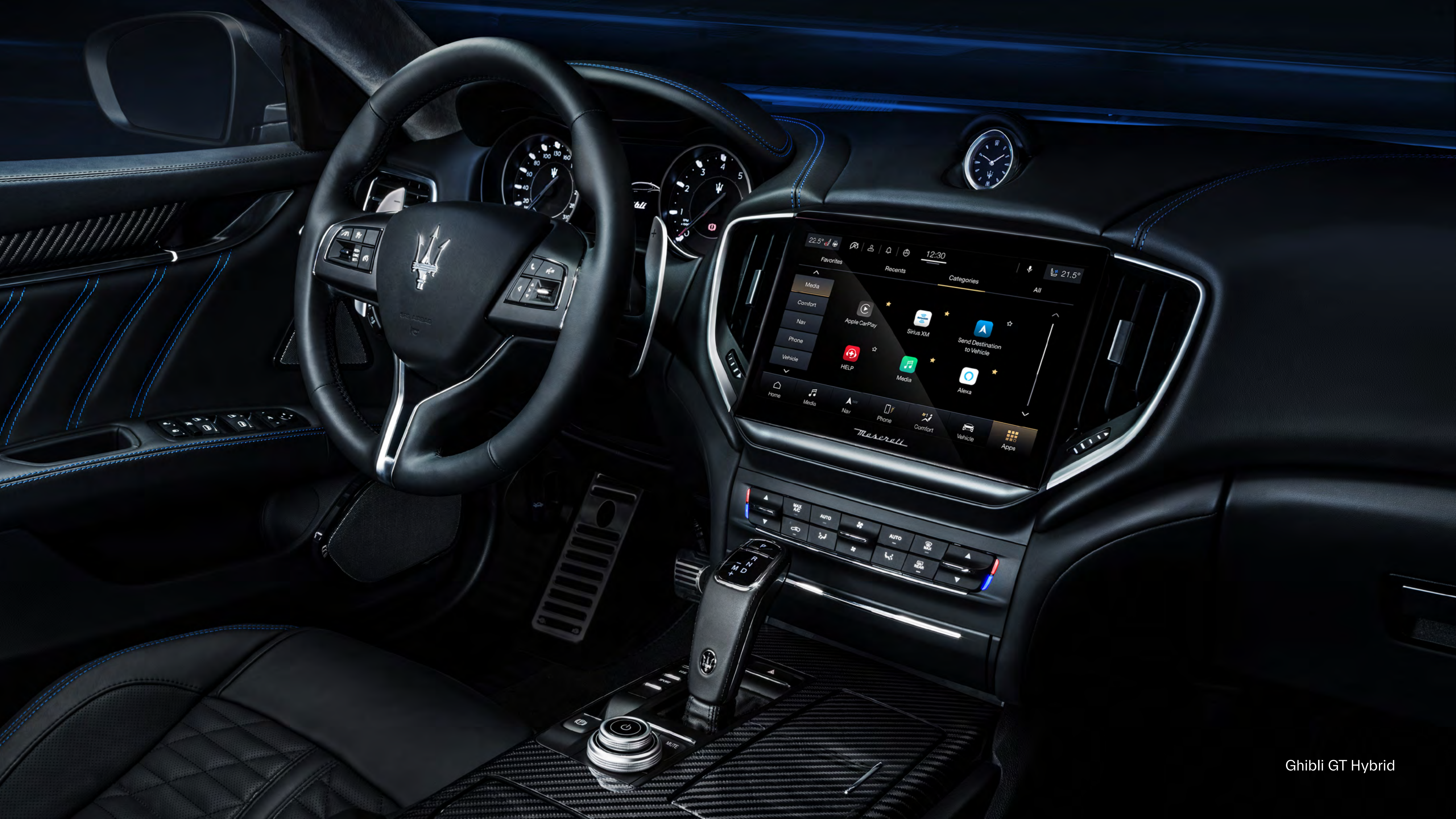
Ghibli GT Hybrid